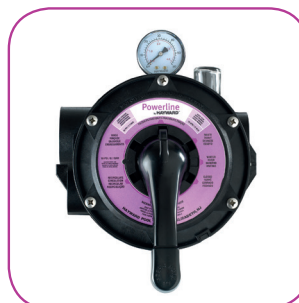
Vanne 6 positions 6 position valve Válvula 6 posiciones