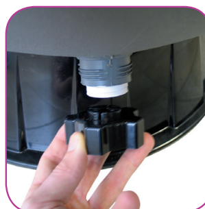
Drain avec son bouchon servant d'outil de démontage Drain with its plug which serves as dismantling tool. Drenaje que sirve para vaciar. El agua del filtro y facilitar así la operación de invernação